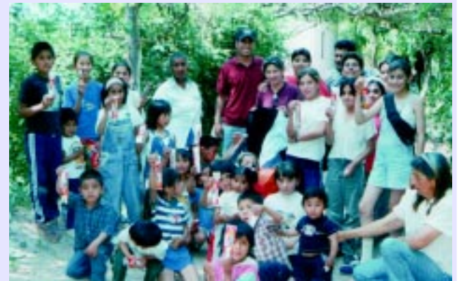
Minera Alumbreira aporta las herramientas y la asociación de vecinos pone en funcionamiento una huerta.

Cuando se gestó la idea de hacer algo barrial, parecía muy utópico. Sin embargo, esta ONG fue adquiriendo