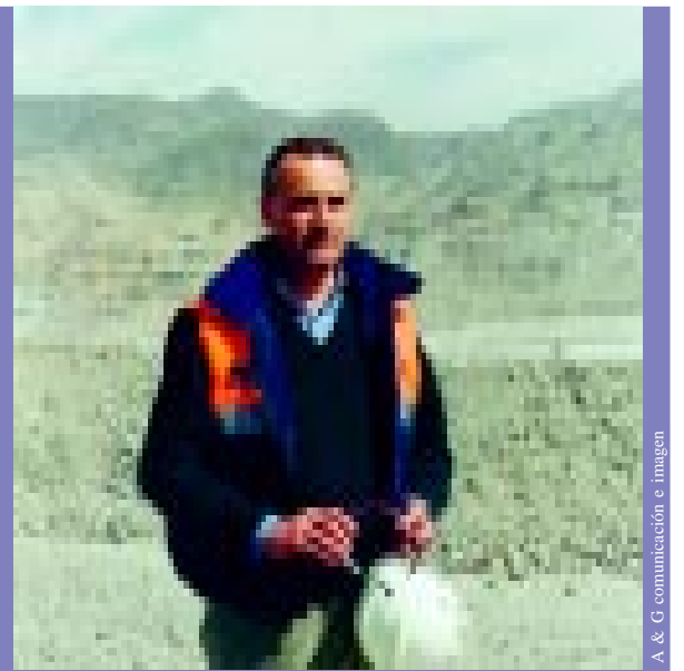
A & G Comunicación e Imagen

Minera Alumbraera apunta al bienestar de sus empleados bajo la premisa de trabajar en un ambiente saludable y libre de lesiones. En su política de Recursos Humanos también fomenta la diversidad cultural y alienta en forma constante el desarrollo de nuevas capacidades para generar posibilidades igualitarias de crecimiento profesional.