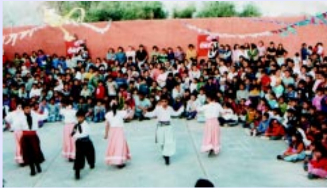
La asociación contribuye en los barrios con ropa, alimentos, artículos para la higiene y médicos.