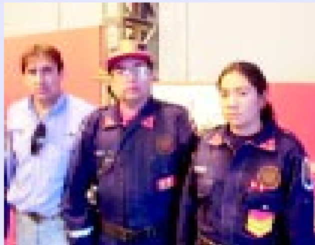
Los bomberos voluntarios y Minera Alumbreira generan capacitación y asesoramiento recíproco

Desde este espacio comunitario no rentado, los bomberos voluntarios de Santa María dedican su esfuerzo a la gente. Además, reciben capacitación tecnológica constante y el cuartel cuenta con un sofisticado y moderno equipamiento tecnológico provisto por la empresa minera.