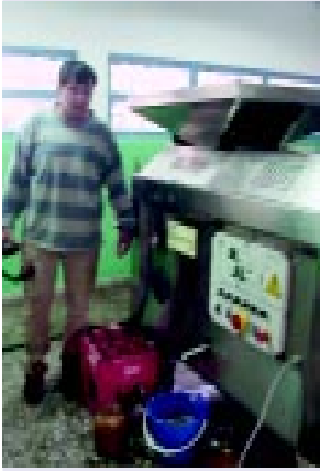
Producción de aceite de oliva

Con el objetivo de brindarle a la comunidad un espacio para comunicar y expresar sus ideas, Minera Alumbraera preparó esta edición a fin de seguir sumando experiencias de gente que trabaja por la comunidad y que recibe el apoyo de la empresa. Al igual que en el suplemento anterior, distintas instituciones y organizaciones no gubernamentales expusieron sus relatos acerca de los emprendimientos sustentables que llevan adelante.