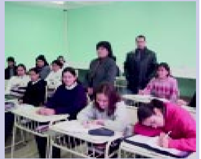
“Gracias a la participación de Minera Alumbreira en el Programa pudimos adquirir 310 libros”, enfatiza la docente.

El objetivo primario es motivar la lectura con literatura amena y desprenderse un poco de los textos de estudio. “Por eso, queremos que los libros que llegan a los destinatarios