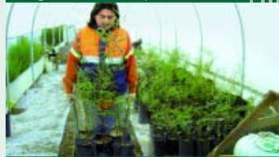
Trabajo con plantines en vivero túnel.