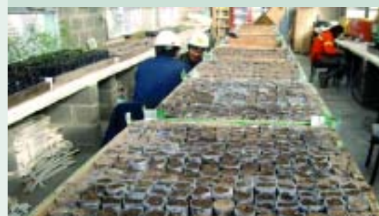
Producción de plantines en laboratorio.

El algarrobo ( Prosopis sp ) es un grupo de especies de origen sudamericano que incluye unas 44 especies de árboles y arbustos con caracteres xerofíticos (vegetales adaptados a los medios secos por su estructura, temperatura u otras causas). En la Argentina hay 28 especies en los ambientes semiáridos. Sus excelentes rasgos, como rectitud del tronco, el crecimiento rápido, la falta de espinas, la elevada producción de biomasa, la producción abundante de frutos y la resistencia a las diferentes presiones ambientales y antrópicas, confirma su importancia desde el punto de vista de la biodiversidad, especialmente en áreas donde otros forrajes provenientes de pastizales y bosques son escasos.