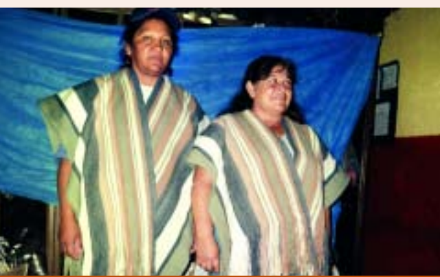
Hoy todas las tejedoras asociadas tienen una obra social, que es absorbida por la cooperativa.

“Arañitas hilanderas” es una cooperativa compuesta por 25 madres que recuperan viejas técnicas de hilado artesanal. Confeccionan el hilo que luego servirá para tejer ponchos de lana de llama marrón y de oveja, que colorearán con tintes extraídos de yuyos naturales. Minera Alumbreira apoya esta importante iniciativa local.