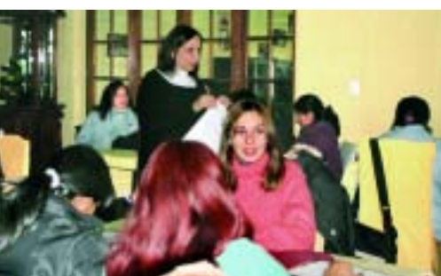
42 profesores finalizaron el seminario de Didáctica de la Matemática, dentro del Plan de Mejora Educativa que financia Alumbreira.

Así surge la didáctica de la matemática con el fin de modificar las prácticas de la enseñanza de esta disciplina. Está pensada desde una mirada crítica respecto de los contenidos que aborda y como facilitadora en la construcción de estrategias profesionales de intervención escolar, centradas en los procesos de apropiación de los contenidos curriculares.