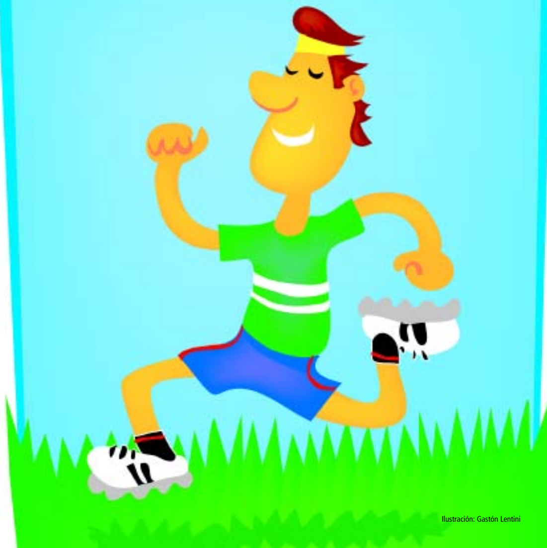
Ilustración: Gastón Lentini

Para las personas que no han desarrollado a lo largo de su vida el interés por este tipo de hábitos saludables, iniciarse en la exigencia física en la adultez suele ser aburrido e incluso frustrante en un primer momento. Para ellos, proponemos algunas reflexiones: